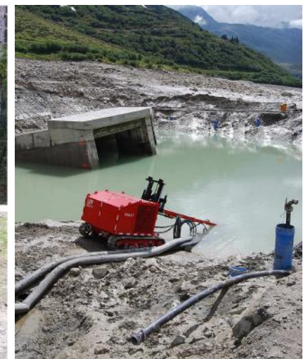
LUF-Multi - 300 PS Dieselmotor